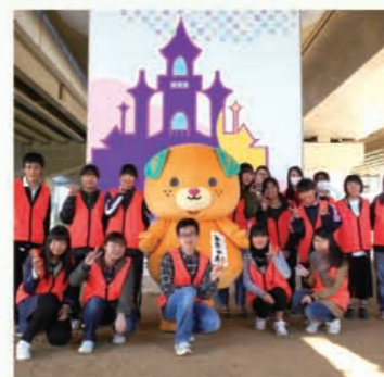
橋脚アートの公開

子どもたちが明るく元気に遊べる公園にするために、平成22年度から公園づくりに参加しています。