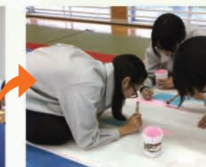
橋脚アートの制作

橋脚アートは松山南高等学校砥部分校の生徒さんに作成していただきました。公開イベントでは、小学生を対象にしたスポーツイベントを実施しました。