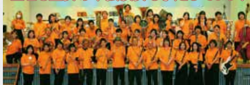
愛媛の一般吹奏楽団体 ウインドアンサンブルいよかんより