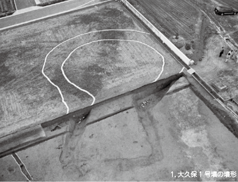
1. 大久保 1 号墳の墳形