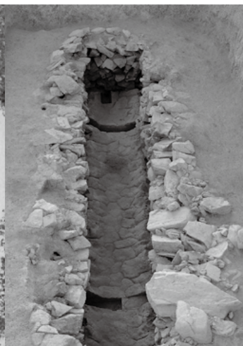
4. 妙見山 1 号墳 1 号主体部竪穴式石槨