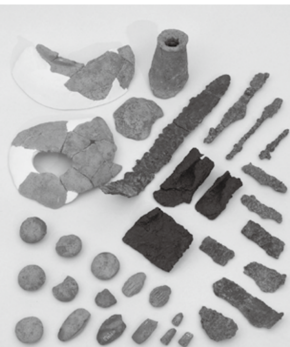
6. 笠置峠古墳から出土した土師器・鉄器・土製模造品