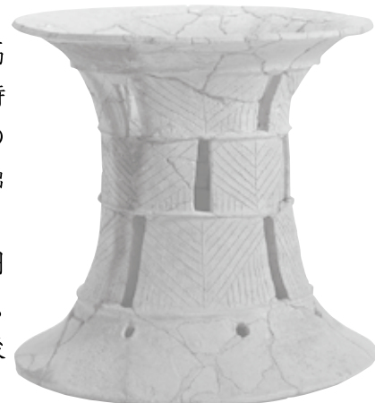
3. 妙見山 1 号墳 伊予型特殊器台

また近年、西予市では笠置峠古墳や小森古墳などの学術調査も行われ、初期前方後円墳に特徴的な左右非対称のいびつな墳形や、墳丘での祭祀などが解明されつつあります。今回の企画展では愛媛県内の前期古墳の調査研究をふりかえるとともに、伊予の前方後円墳の特徴をまとめて紹介します。