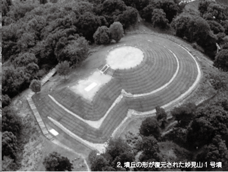
2. 墳丘の形が復元された妙見山 1 号墳