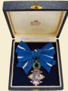
スペイン国文化勲章 (メリト・シビル勲章)

今治市で生まれる。昭和33年ニューヨークのメトロポリタン歌劇場で、日本人初のプリマドンナとして「蝶々夫人」を歌い一躍有名となる。日本とスペインの友好親善のため「日本・スペイン歌の協会」を設立、会長として活躍。昭和61年、スペインより日本人声楽家初の「文化勲章」を贈られた。