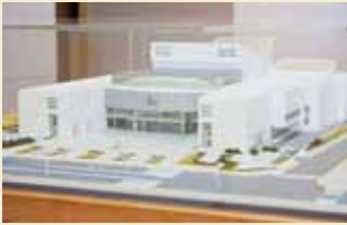
ひめぎんホール(愛媛県民文化会館)模型

日本人建築家として最も早く国外でも活躍した一人。第二次世界大戦後から高度経済成長期にかけて、多くの国家プロジェクトを手がける。作品に広島平和記念公園、東京代々木の国立屋内総合競技場、東京カテドラル聖マリア大聖堂、東京都新庁舎など。昭和55年文化勲章。同62年ブリッカラー賞。