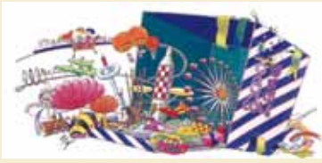
挿絵「眞鍋博のエキスポファンタジー」(愛媛県立美術館蔵)

宇摩郡別子山村(現、新居浜市)で生まれる。多摩美術大学大学院美術研究科修了。昭和30年、朝日ジャーナル連載「第七地下壕」で第一回講談社さしえ賞受賞。星新一、筒井康隆などのSF小説の挿絵を多く描いた。また、大阪万博、沖縄海洋博、科学博などにも参画し、多方面で活躍した。