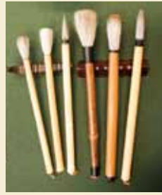
愛用の筆 (今治市上浦歴史民俗資料館蔵)

越智郡瀬戸市現、今治市上浦町出身。辻本史邑に師事。日展で昭和23年特選、同39年文部大臣賞、同43年「杜甫贈高式顔詩」で芸術院賞受賞。同35年日本書芸院理事長となり、関西書道界の発展に尽力した。同60年芸術院会員。平成10年文化勲章。日展理事・顧問、日本書芸院理事長などを歴任した。