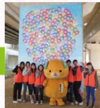
(平成25年度の作品です)

子どもたちが安心して遊べる公園にするために平成22年度から参加しています。橋脚アートの公開イベントでは小学生対象のレクリエーション活動を行います。今年度は松山南高等学校砥部分校のみなさんに橋脚アートのデザインをしていただきました。