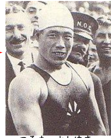
つるた よしゆき 鶴田 義行

私は、オリンピックで日本の水泳選手として初めて優勝しました。私の金メダルをぜひ見てください。