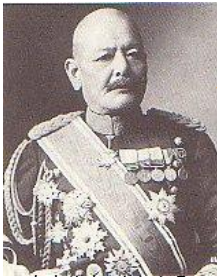
あきやま よしふる 秋山 好古

私と弟の真之は、ロシアとの戦いで活躍をしました。私の軍服や指揮刀などを展示しているので見てください。