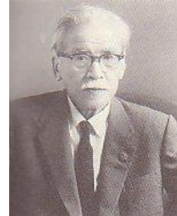
あべ よししげ 安倍 能成