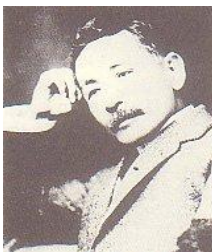
なつめ そうせき 夏目 漱石