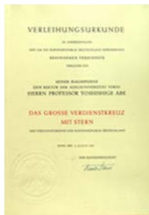
大功勞十字星章表彰状