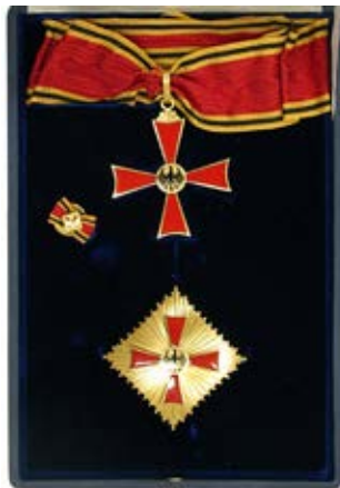
大功勞十字星章勲章