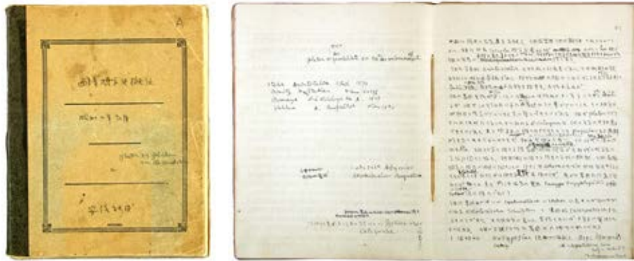
講義ノート（西洋哲学史概説1）